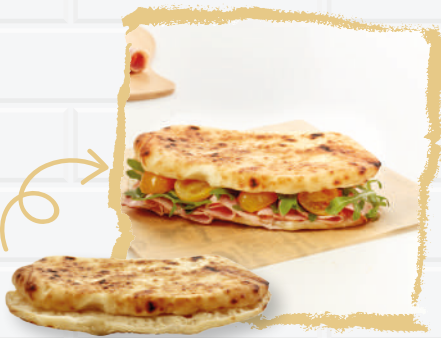
Panuozzo di gragnano