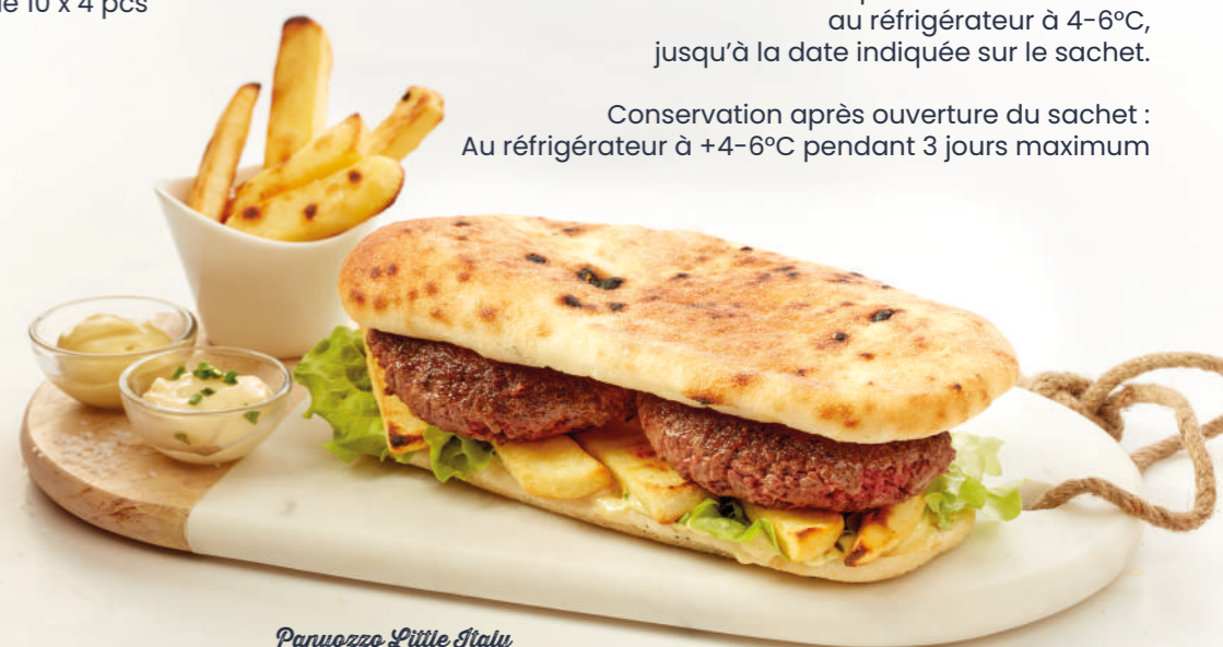
Panuozzo Little Italy